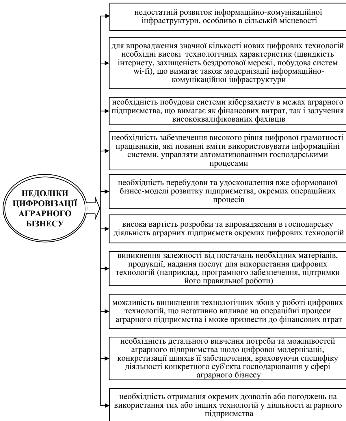
Рис. 3. Негативні наслідки цифровізації аграрного бізнесу

Також у статті вагома увага приділена обґрунтуванню сутності та особливостей цифровізації саме аграрного бізнесу. На основі визначення сутності такого бізнесу у статті конкретизовано зміст поняття «цифровізація аграрного бізнесу». Також, враховуючи особливості здійснення бізнесу в аграрній сфері, у статті визначено особливості цифровізації такого бізнесу.