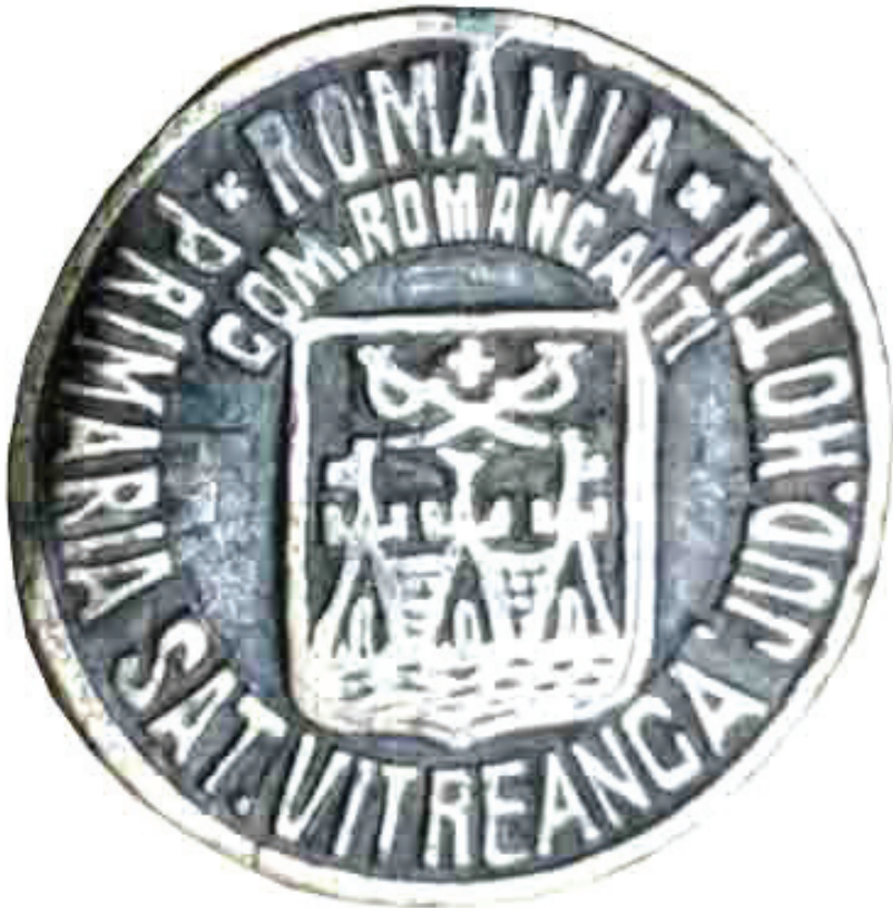
Рис. 1. Печатка примарії с. Вітрянка.

До 1925 р. Вітрянка, разом із ще тринадцятьма селами, адміністративно належала до Романківецької волості Хотинського повіту. А після реформи – до пласи (округу) Сокиряни Хотинського повіту, котра включала всього 28 населених пунктів. Оскільки на печатці не вказано приналежності до волості Романківці, а мова йде про комуну (громаду), то це дає підстави припустити, що печатка виготовлена і використовувалася після 1925 р. Очевидно, що на щиті відображено герб м. Хотин як адміністративного центру всього повіту, який використовувався ще з XIX ст. Якщо така думка правильна, то верхню хронологічну межу артефакту (як і аналогічної печатки с. Недобоївці) варто обмежити 1930 р., коли був затверджений новий герб м. Хотин.