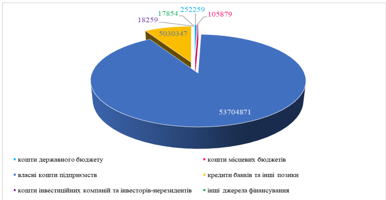
Рис. 2. Обсяги капітальних інвестицій в аграрному секторі України у 2019 р. за джерелами фінансування, млн. грн.

для зовнішніх інвесторів, що зменшує ризик їхніх інвестицій. Зрештою, інвестування власного капіталу дає підприємству більшу автономію та незалежність у прийнятті стратегічних рішень, оскільки воно не супроводжується умовами, які зазвичай накладаються зовнішніми фінансовими джерелами. Тому розглянемо структуру джерел фінансування інвестицій аграрних підприємств України (рис. 2).