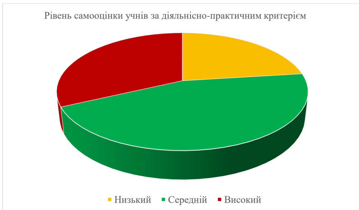
Рисунок 2.3. Рівень розвитку самооцінки молодших школярів за діяльнісно-практичним критерієм.

Підсумовуючи результат дослідження за діяльнісно-практичним критерієм, ми зробили висновки, що в школярів 2 класу переважає самооцінка середнього рівня – близько 45%, у 23 % учнів класу низька самооцінка, а в решти – 32 % завищена самооцінка.