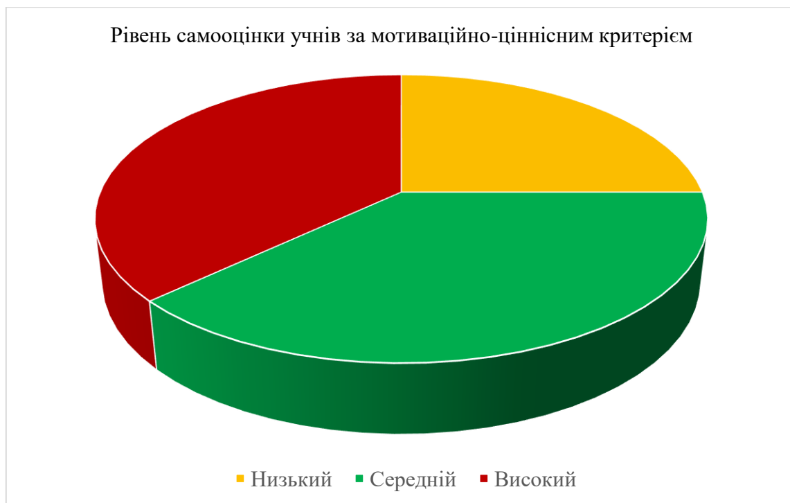
Рисунок 2.2. Рівень самооцінки молодших школярів за мотиваційно-ціннісним критерієм

Діагностика за діяльнісно-практичним компонентом самооцінки була спрямована на визначення вмій молодші школярі: