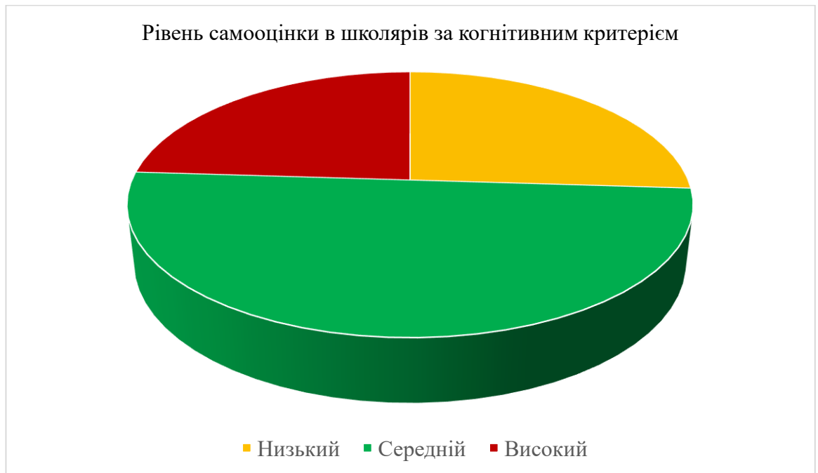
Рисунок 2.1. Рівень розвитку самооцінки молодших школярів за когнітивним критерієм

Дане дослідження дало нам можливість виявити наявність уявлення в школярів молодшого шкільного віку про самооцінку та чи вміють вони знаходити в собі та в інших позитивні та негативні сторони. Це дає нам підставу зробити висновок, що для першокласників, які лише почали навчатися, когнітивний компонент розвинений дещо в меншій мірі. Для того, щоб учень 1-го класу навчився визначати свої позитивні та негативні сторони, потрібен досвід з обов'язковим включенням в навчальний процес. Тобто для учнів 2 та старших класів поступово сформувалися ці знання про себе, тому вони дежко можуть оцінювати свої вміння, свою діяльність та поведінку з чужої точки зору.