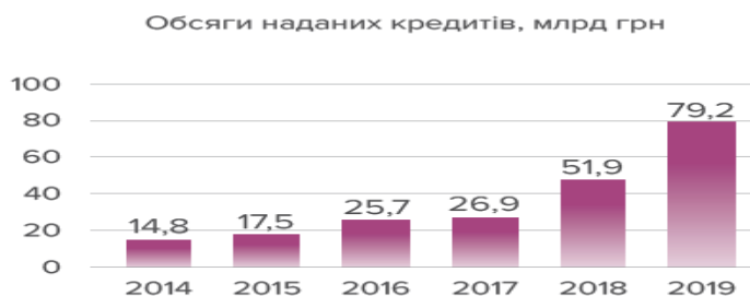
Рис. 3. Обсяги наданих кредитів, млрд. грн.

За 2019 рік фінансовими компаніями було укладено договорів з фізичними особами (крім фізичних осіб-підприємців (ФОП)) на суму 43,7 млрд. грн., що на 50% перевищує аналогічний показник 2018 року (29,1 млрд. грн.). При цьому 40,3% договорів (31,9 млрд. грн.) від загальної суми - строком до 30 днів і деякі з них могли бути переукладені клієнтом протягом зазначеного періоду. Відтак обсяги видачі дещо завищені через значну оборотність (Рис. 3).