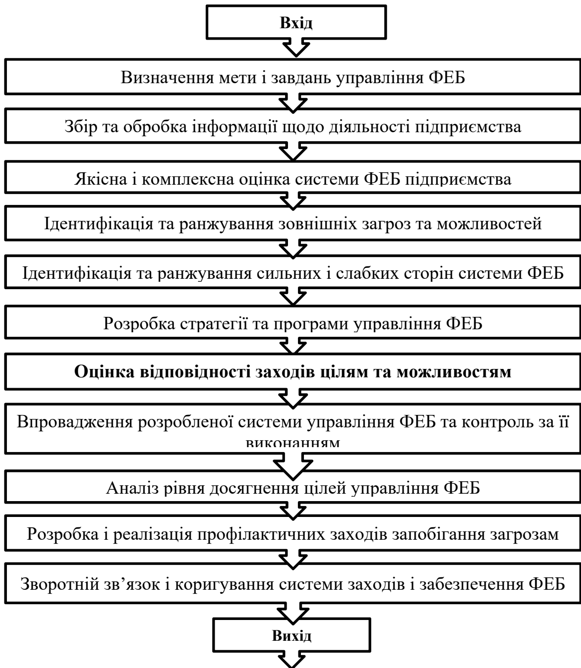
Рис. 1. Алгоритм управління економічною безпекою підприємства

підприємства з інтересами суб'єктів зовнішнього середовища, з урахуванням особливостей діяльності підприємства. Процес управління ФЕБ включає наступні етапи (рис. 1).