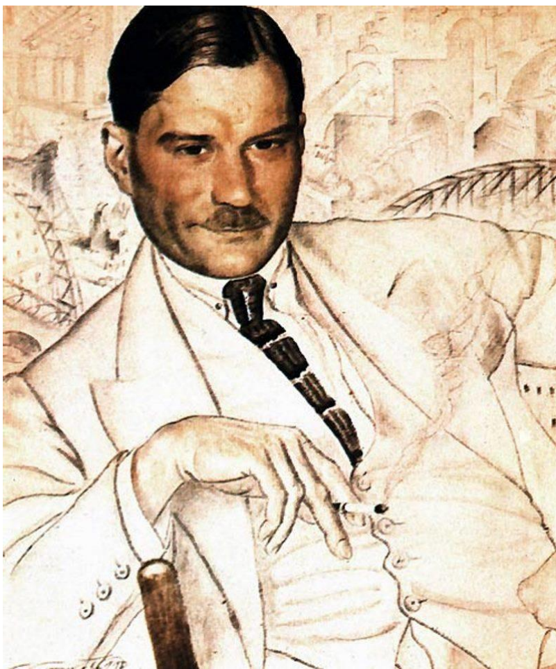
Б. М. Кустодиев Портрет Е. И. Замятина 1923 г.