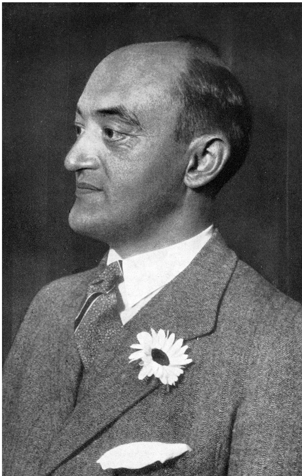
ЙОЗЕФ АЛОЇЗ ШУМПЕТЕР