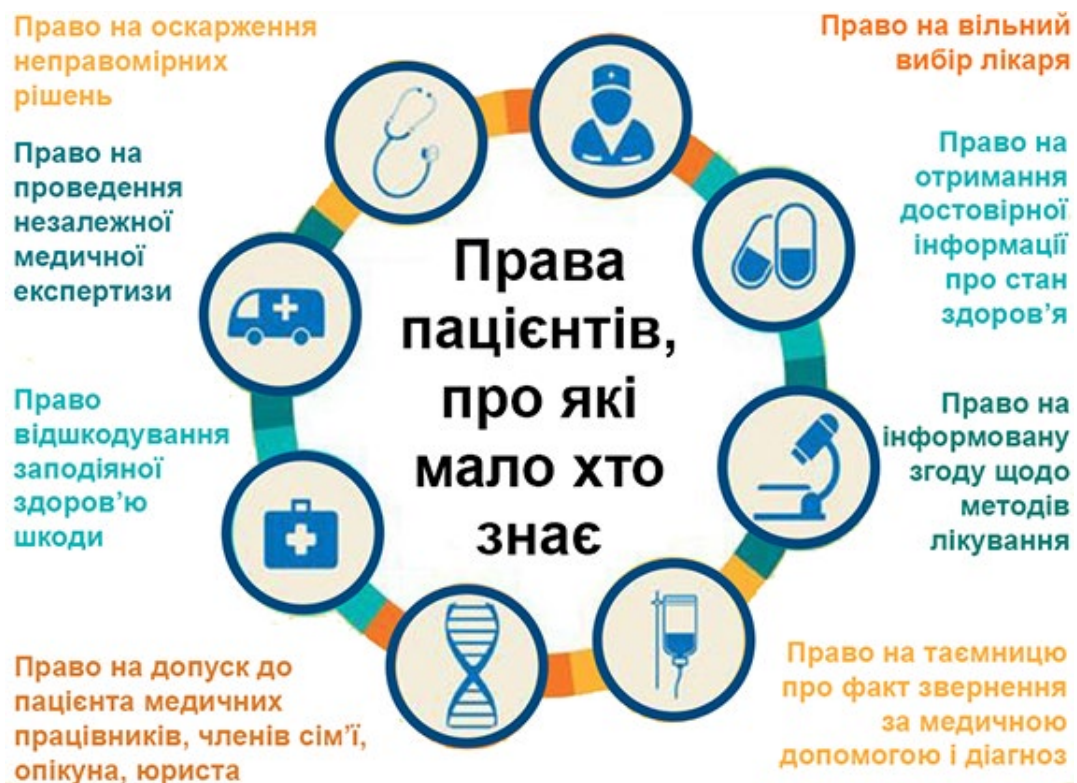
Мал. 2. Права пацієнтів