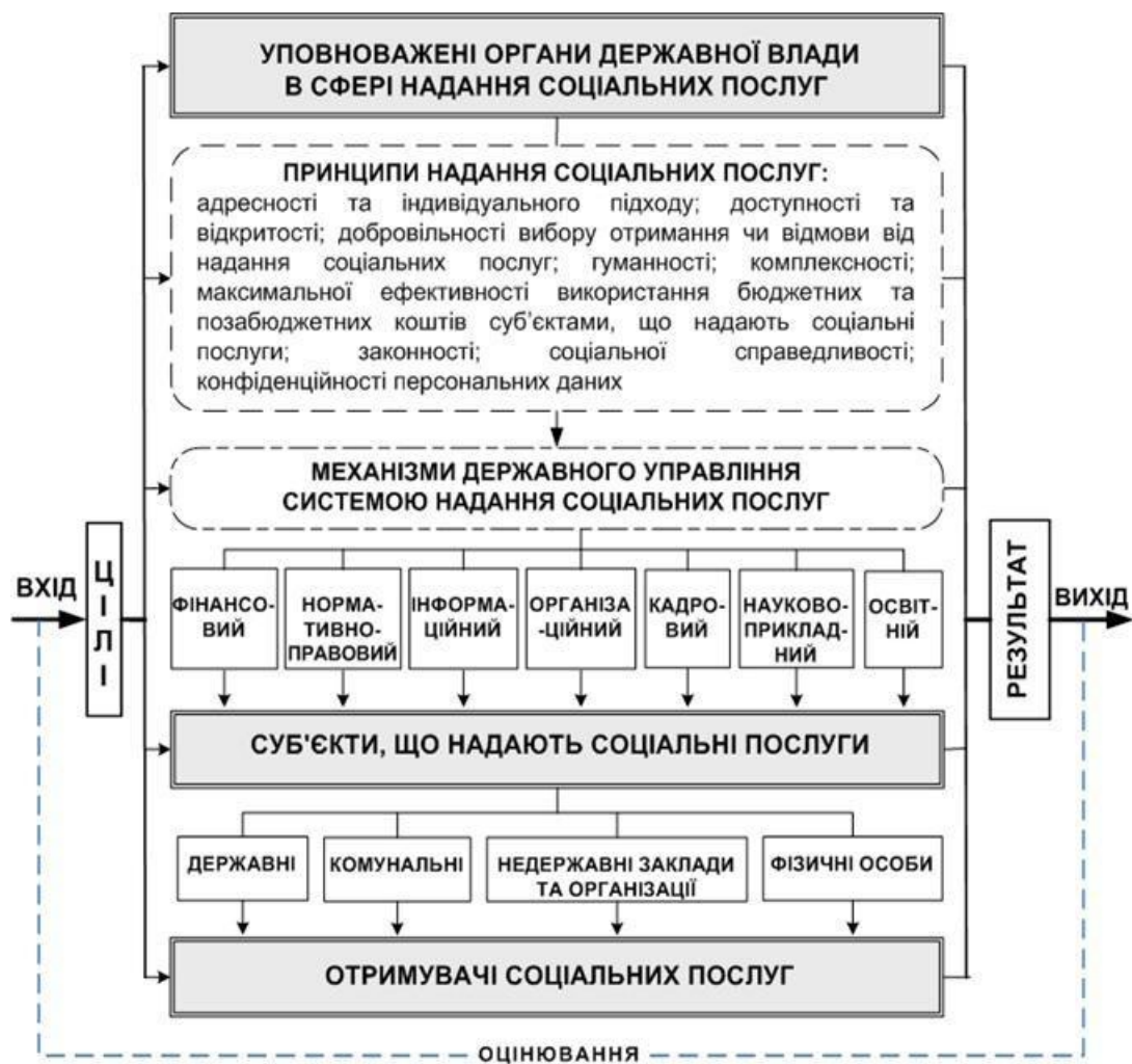
Мал 1. Схема системи надання соціальних послуг як об'єкту державного управління

Отримувачі соціальних послуг – особи/сім'ї, які належать до вразливих груп населення та/або перебувають у складних життєвих обставинах, яким надаються соціальні послуги [7].