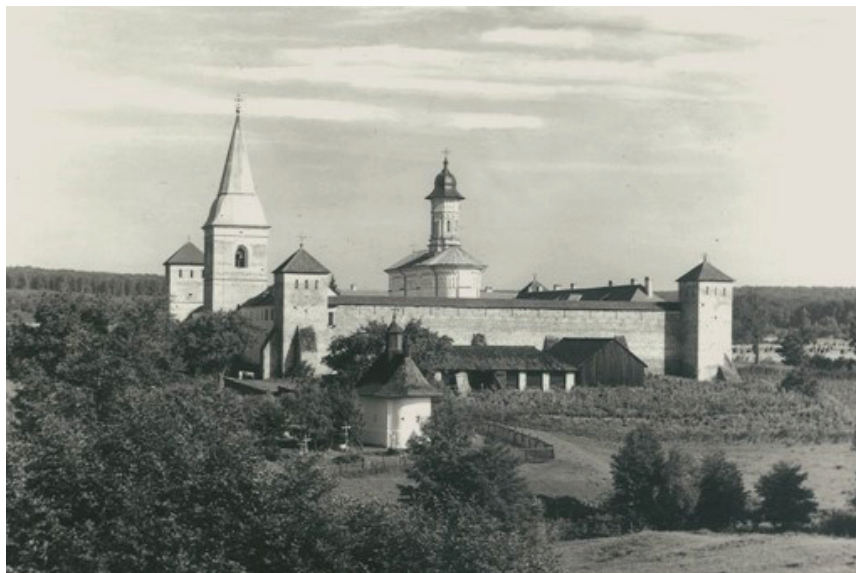
Фото 1. Монастир Драгомирна.

монастирю в сумі 60 злотих, про що залишили запис. Також багато цінних рукописних церковних книг з пограбованого козаками Драгомирненського монастиря було викуплено представниками місцевої молдавської аристократії у Тимошевих козаків перед їхнім відходом в Україну або були придбані опісля «в країні козаків».