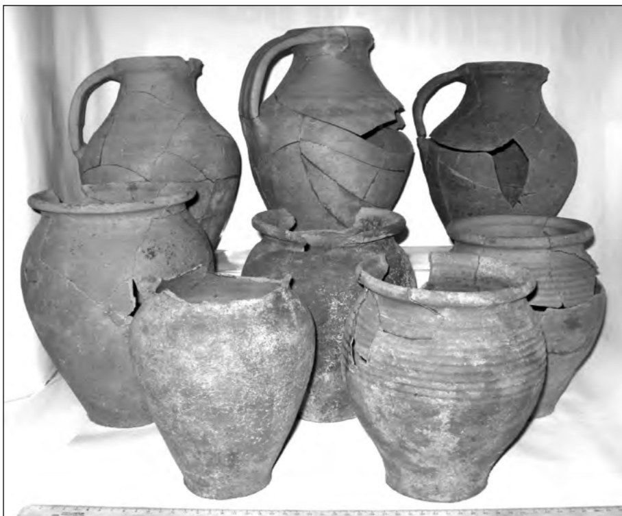
Рис. 1. Керамічний посуд з гончарного горна у м. Чернівці.

мітних домішок у тісті, з поясками горизонтальних або хвилястих заглиблених ліній (Рис. 1). У верхній частині заповнення горну серед кераміки знайдено кістяний гудзик (?) та особливо важливий для датування комплексу мідний пів-