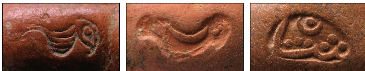
Рис. 2. Зразки клейм на люльках із Хотинської фортеці

Третій розкоп у підвалі двору коменданта в підніжжі Північної вежі засвідчив насичену