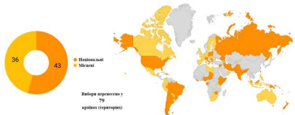
Мал. 2.2 Кількість перенесених виборів по рівнях виборів [127].