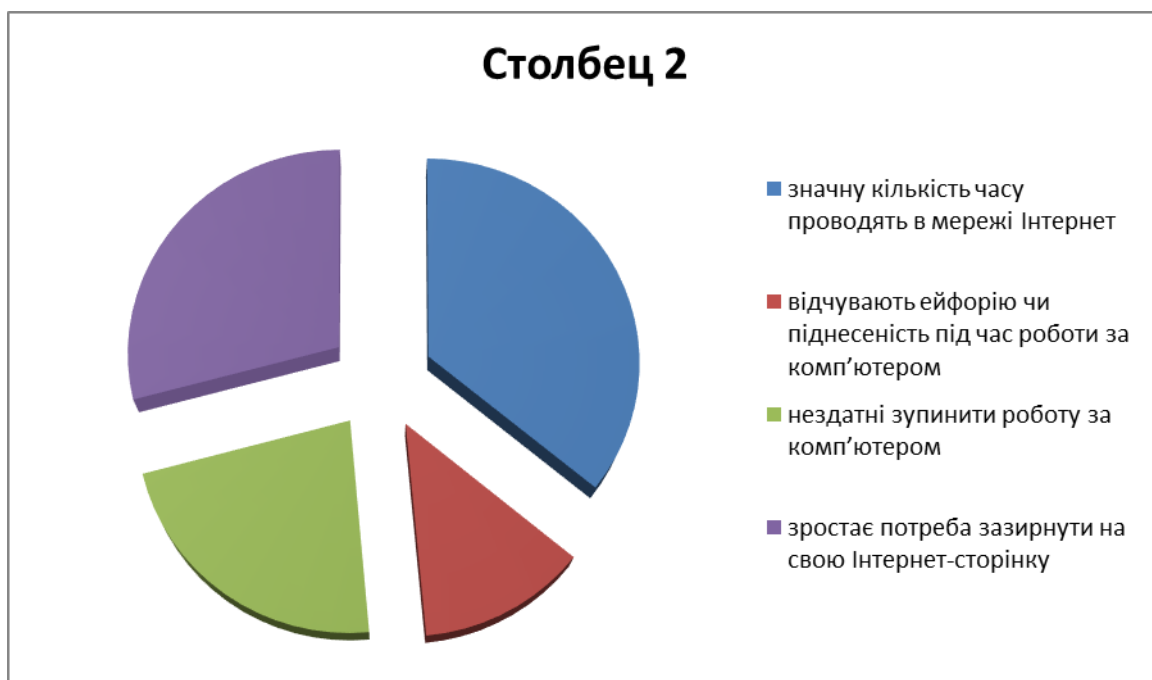
Рис. 1.2. Визначальні ознаки Інтернет-залежності, які респонденти спостерігали за собою.

Відповіді на наступне запитання анкети дозволили констатувати, що серед визначальних ознак Інтернет-залежності, які респонденти спостерігали за собою є: значна кількість часу проводиться в мережі Інтернет (22 учні – 74 %); нездатність зупинити роботу за комп'ютером (14 учнів – 46%), відчуття ейфорії чи піднесеності під час роботи за комп'ютером (8 учнів – 26%). Обираючи свій варіант, 18 учнів (60%) зазначили, що у них зростає потреба зазирнути на свою Інтернет-сторінку, переглянути сторінки друзів, що, в свою чергу, в подальшому може викликати потребу у патологічному використанні Інтернету, що демонструє Рис.1.2.