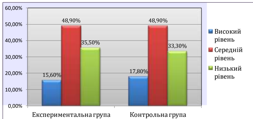
Рис. 2.3. Результати сформованості толерантної поведінки у дітей старшого дошкільного віку в експериментальній (ЕГ) і контрольній (КГ) групах (констатувальний етап експерименту)

Результати обстеження, що визначають ступінь вихованості в дитини знань та розуміння, ціннісного ставлення, умінь та толерантної поведінки, скоригували і підтвердили наші припущення щодо характеристик дітей за трьома рівнями вихованості толерантної поведінки: