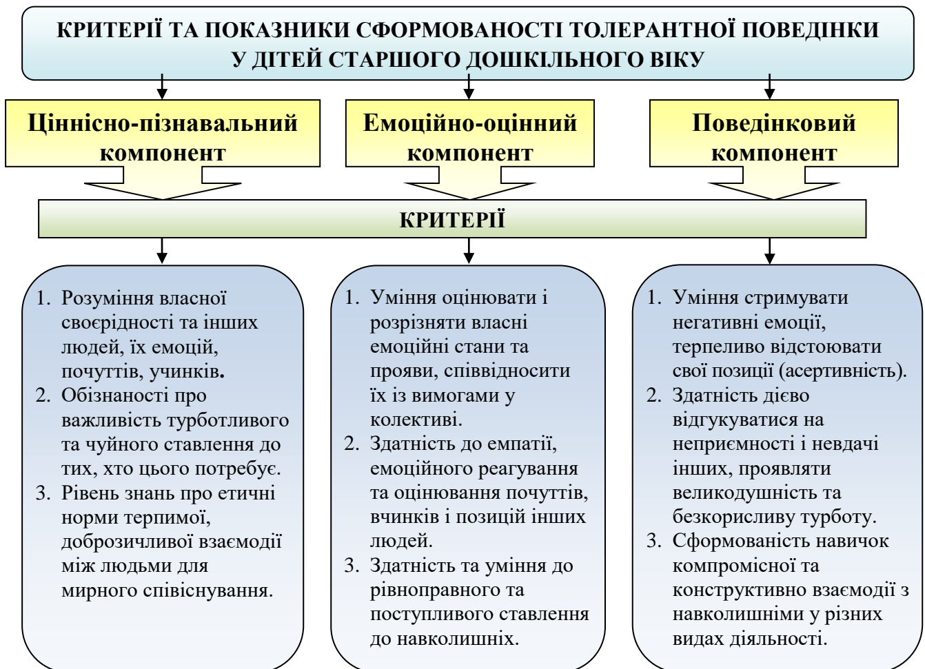
Рис. 2.2. Показники і критерії сформованості толерантної поведінки у дітей старшого дошкільного віку

Спочатку нами було виявлено стан вихованості толерантної поведінки старших дошкільників за критеріями ціннісно-пізнавального компоненту , бо знання, які отримує дитина актуалізують її моральний досвід, збагачують моральними поняттями, вчать робити висновки і врешті решт впливають на сам процес формування особистості. Для цього нами були розроблені і використані ряд методик до кожного із означених показників ( Додаток Г ).