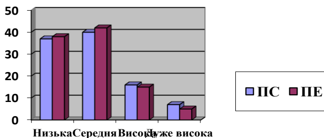
Рис. 1. Ступінь вираженості лідерських здібностей аспірантів психологічного та педагогічного профілів за методикою «Діагностика лідерських здібностей» (Е. Жариков, Е. Крушельницький)