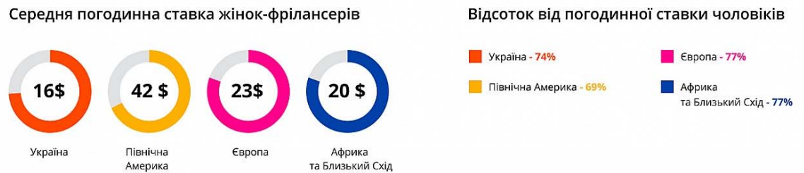
Рис. 3. Гендерний розрив в оплаті праці жінок-фрілансерів [3; 6].

В Україні гендерна нерівність в доходах фрілансерів виражена ще більше ніж в світі. Українські жінки отримують 74% середньої погодинної ставки чоловіків, в той час як в світі цей розрив менше – 84% [3; 6].