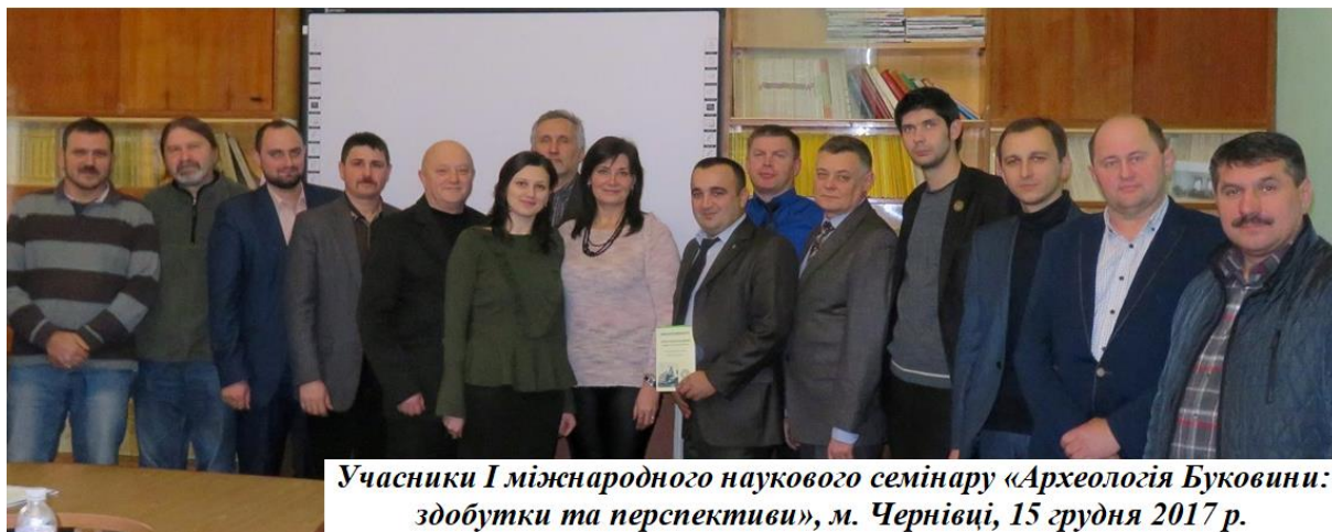
Учасники I міжнародного наукового семінару «Археологія Буковини: здобутки та перспективи», м. Чернівці, 15 грудня 2017 р.