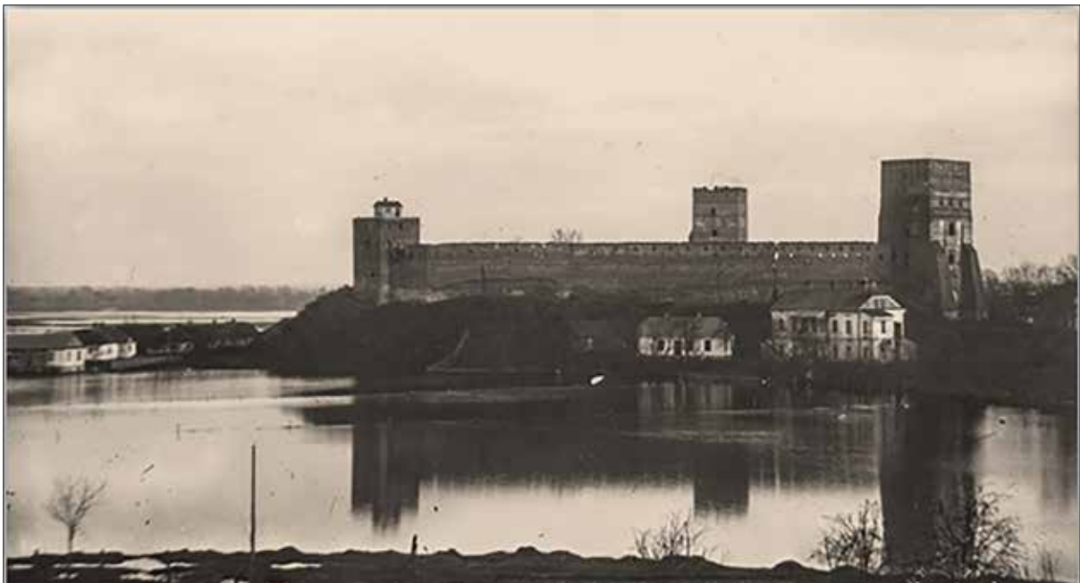
Вигляд на Луцький замок