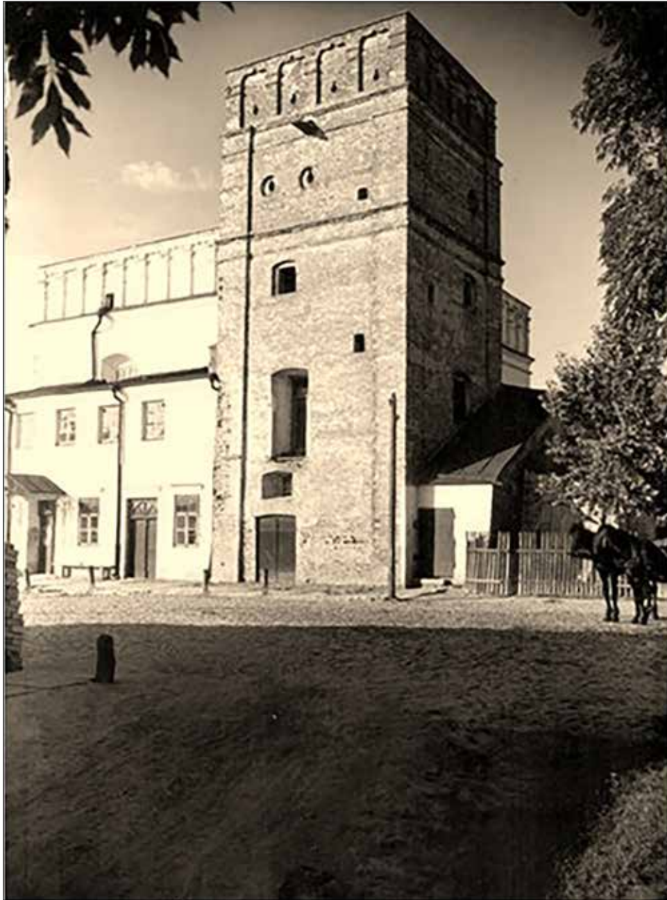
Вежа біля синагоги у 1920-х роках.