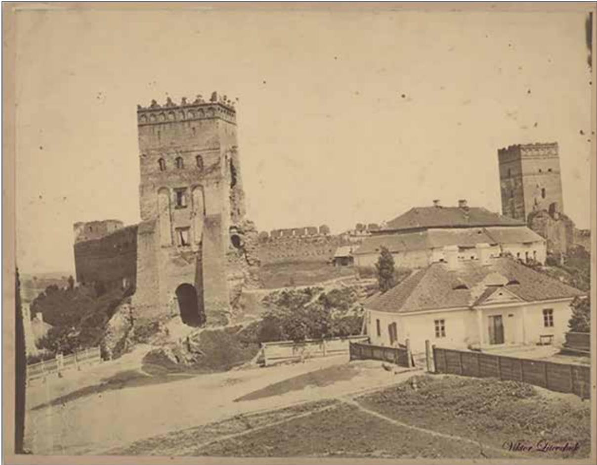
Луцький замок. 1880–1890 роки