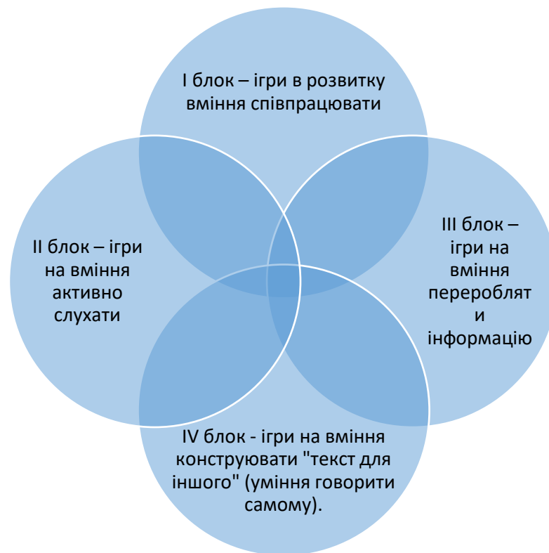
Рис. 2.2 Блоки ігор з розвитку комунікативних здібностей

Ігри з розвитку комунікативних здібностей проводяться в системі та розділені на 4 блоки (Рис. 2.2):