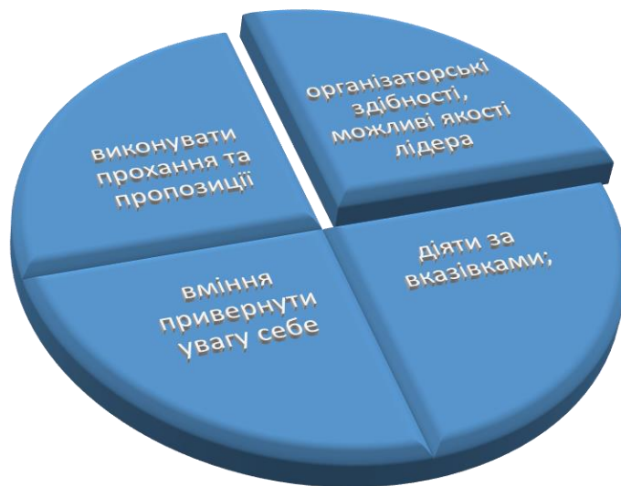
Рис. 2.4. Якості які розвиваються в процесі роботи з дітьми

У процесі роботи у дітей розвиваються наступні здібності (Рис. 2.4):