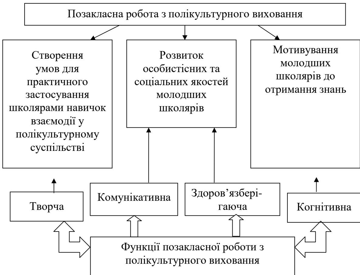
Рис. 1.2. Особливості позакласної роботи з полікультурного виховання молодших школярів

Розглянемо ці особливості більш ретельно. Така особливість, як створення умов для практичного застосування школярами навичок взаємодії у полікультурному суспільстві реалізується через застосування різних форм організації позакласної роботи, у яких школярі не тільки виявляють свої індивідуальні особливості, які не завжди вдається розпізнати на уроці, а й вчаться жити в колективі, тобто співпрацювати один із одним.