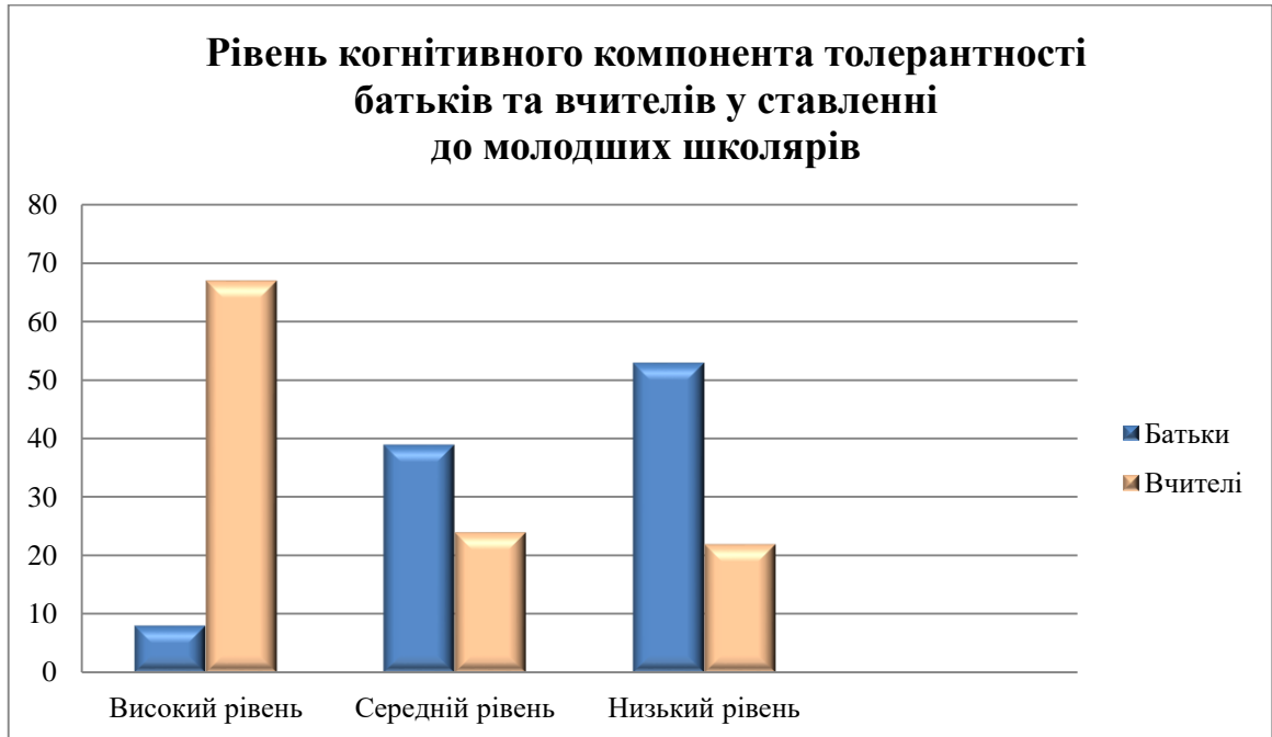
Рис. 2.2. Рівень когнітивного компонента толерантності батьків та вчителів у ставленні до молодших школярів

Для унаочнення результатів рівня когнітивного компонента нами побудована гістограма (див. рис.2.2.).