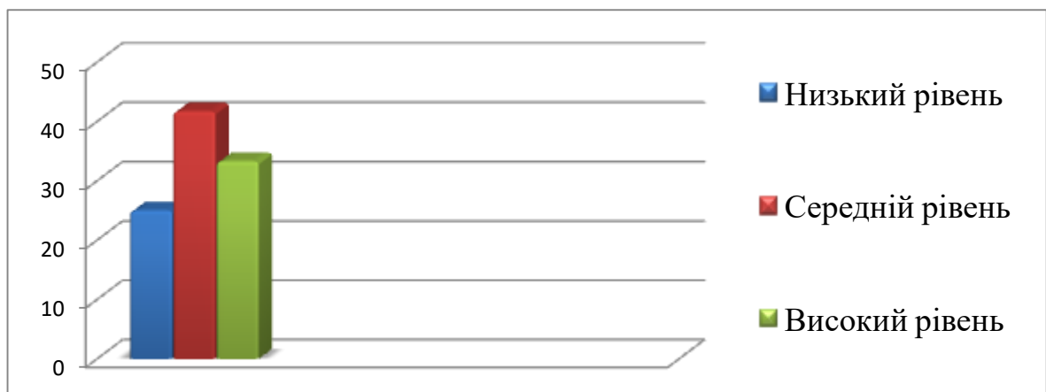
Рис. 2.3. Дослідження розвитку пізнавального інтересу молодших школярів за пізнавальним критерієм

Результати дослідження проявів пізнавального критерію розвитку пізнавального інтересу учнів початкових класів на уроках образотворчого мистецтва проілюстровано в діаграмі 2.3.