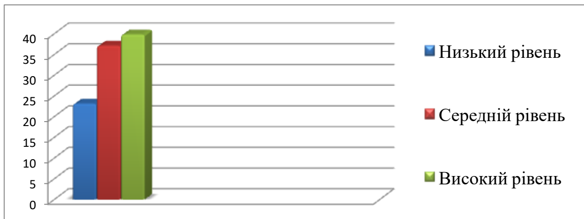
Рис. 2.4. Дослідження стану розвитку пізнавального інтересу молодших школярів на уроках образотворчого мистецтва

Узагальнені кількісні результати дослідження стану розвитку пізнавального інтересу молодших школярів на уроках образотворчого мистецтва подано в діаграмі 2.4.