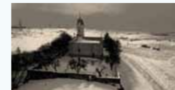
Kloster Hagigadar, Suceava