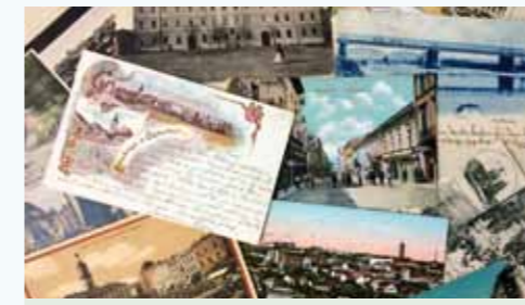
Postkarten aus der Sammlung Kasparides

(In Kooperation mit dem Museum und der Galerie der Stadt Schwabmünchen)