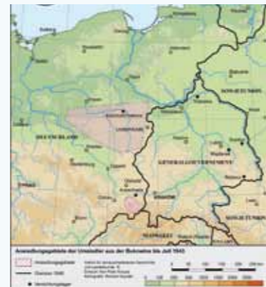
Ansiedlungsgebiete der Umsiedler aus der Bukowina bis Juli 1943 (Quelle: IdGL Tübingen, Entwurf: Karl-Peter Krauss, Kartografie: Richard Szydiak)

Im Herbst 1940 siedelte die Volksdeutsche Mittelstle Deutsche aus der Nordbukowina um, die seit Ende Juni zur Sowjetunion gehörte. Durch die Intervention des deutschen Generalkonsuls aus Czernowitz wurden ebenfalls viele gefährdete Rumänen ins besetzte Polen gebracht. Im Anschluss begann auch die Umsiedlung der nicht bedrohten Deutschen aus der Südbukowina, weil die Nationalsozialisten deutsche Siedlungsschwerpunkte an den Außengrenzen des Deutschen Reiches errichten wollten. Von den insgesamt 95.770 Umsiedlern aus der Bukowina kamen viele aus ethnisch gemischten Familien. Da diese nicht in Himmlers Plan zur Germanisierung passten, verblieben viele bis 1945 in den Lagern. Diejenigen, die angesiedelt wurden, sahen, wie ihre Wege zehntausende Polen vertrieben wurden.