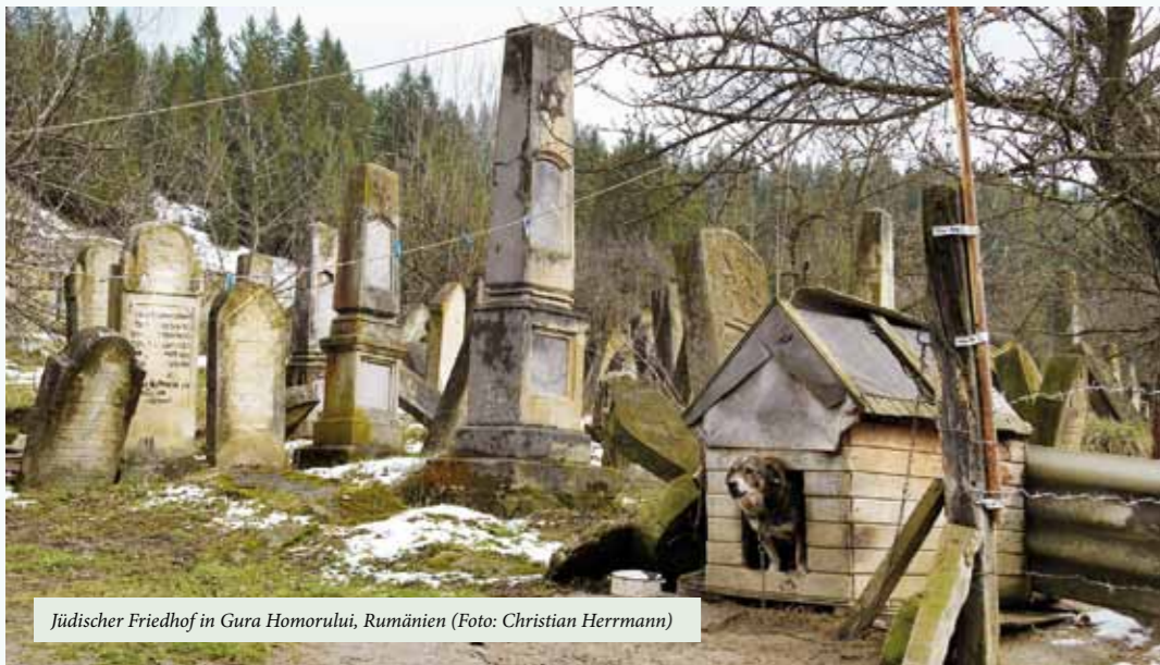
Jüdischer Friedhof in Gura Homorului, Rumänien

Im Osten Europas, in einem Gürtel zwischen Baltikum und Schwarzem Meer, lebte einst die Mehrheit der europäischen Juden. Während des Zweiten Weltkriegs wurden sie von den deutschen Besatzern und ihren Helfern nahezu vollständig ermordet. Geblieben sind die Spuren früheren jüdischen Lebens: zerstörte oder zweckentfremdete Synagogen, überwucherte Friedhöfe, Grabsteine im Straßenpflaster, Spuren von Hausseen an den Türpfosten.