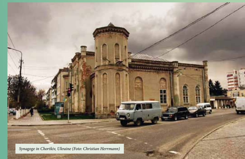
Synagoge in Chortkiv, Ukraine