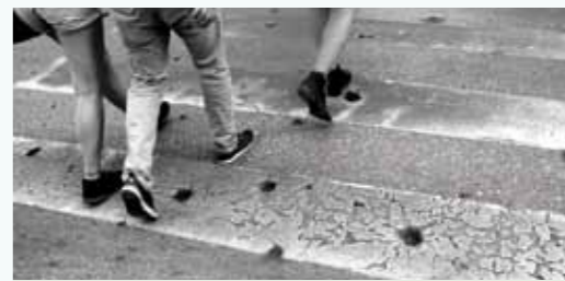
Einschusslöcher auf einer Straße in Mostar

AUSSTELLUNG Donnerstag, 25. April 2019 – Donnerstag, 26. September 2019 Vernissage: 25. April 2019, 19:00 Uhr