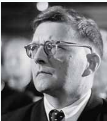
Dmitri Shostakowitsch

KONZERT Dienstag 29. Januar 2019, 19:00 Uhr, Leopold-Mozart-Zentrum, Konzertsaal