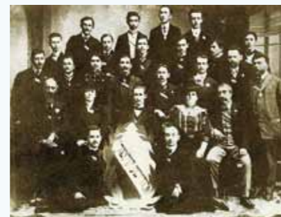
TeilnehmerInnen der Konferenz für die jiddische Sprache