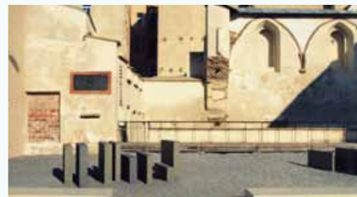
Denkmal für die 1941 von den Nazis zerstörte Synagoge in Lemberg, Ukraine

(In Kooperation mit dem Jüdischen Museum Augsburg Schwaben, dem Lehrstuhl für Neuere und Neueste Geschichte und dem Institut für Zeitgeschichte München-Berlin)