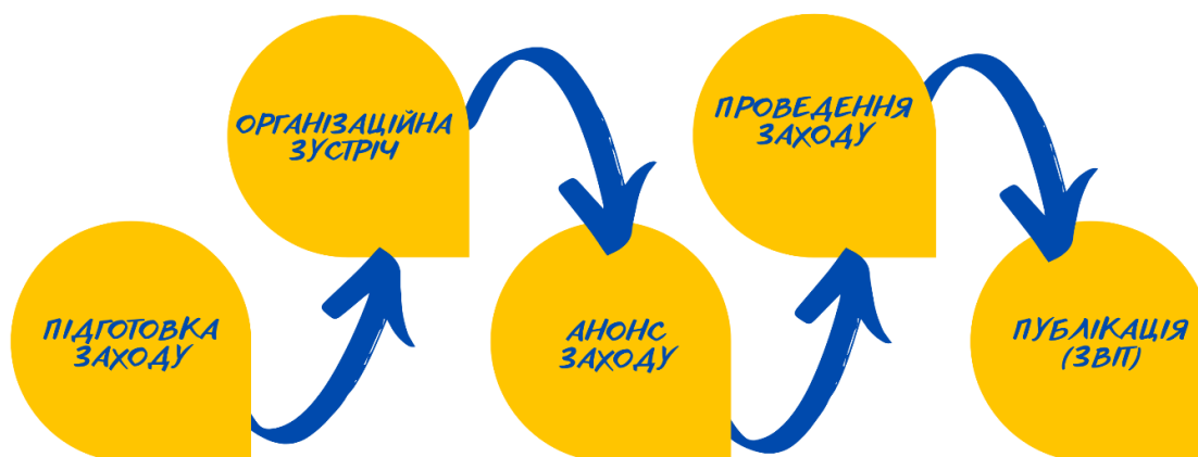
Рис. 1. Технологія проведення заходів для дітей-переселенців

Під час реалізації та організації заходів для дітей ВПО ми керувались певною технологією, яку ми розробили та адаптували у ході проведення цих заходів (Рис. 1). Першим етапом до реалізації заходу є його підготовка, яка здійснюється усіма залученими учасниками. Сюди належить визначення мети заходу, його складників, виділення ролей учасників, цільової аудиторії, напрям заходу, на якому базуватимуть наступні етапи. Другий етап – організаційна зустріч, під час якої усі залучені особи обговорюють реалізацію заходу, організаційні питання; відбувається розподіл ролей, за які відповідальні учасники. Під час цього етапу створюється макет (сценарій) майбутнього заходу. Третій етап – анонс заходу: створюється прес-реліз, який розміщується на сайті громадської організації, соціальних мережах організації та зацікавлених сторін, долучених до проведення заходу. Четвертий етап – проведення заходу. П’ятий етап – публікація результатів заходу (звіт), де розміщуються фото і відеоматеріали підкріплені текстовим описом проведення заходу, зазначаються учасники, присутні гості, коротко описується весь захід.