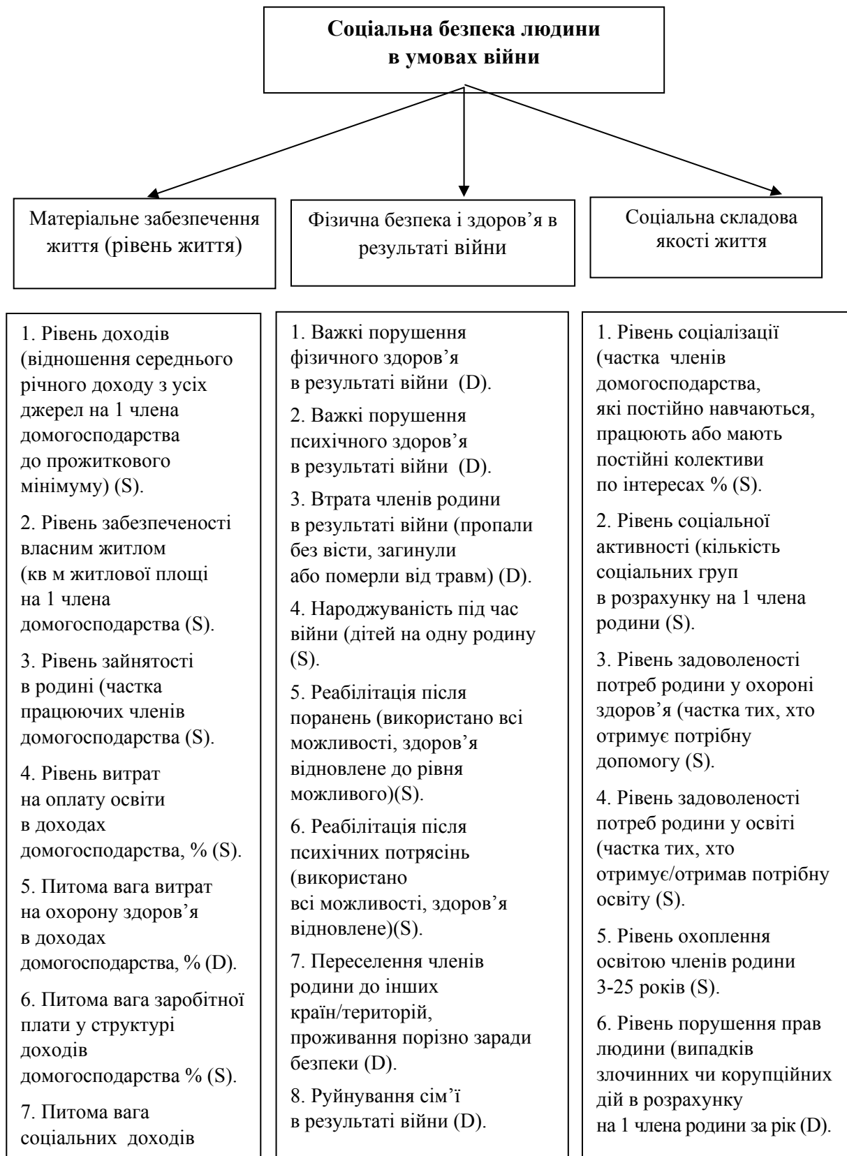
Рис. 1. Структура соціальної безпеки людини в умовах війни та її індикатори.

Визначена структура соціальної безпеки включає 21 індикатор, перелік яких не є догмою та може змінюватись залежно від цілей, глибини та об'єктів дослідження.