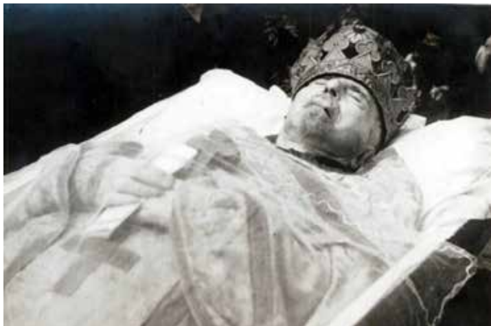
Funeraliile arhiepiscopului Dr. Cassian Bohatyreț (1960)

însă pensia lunară de 300 de ruble, pe care i-a stabilit-o comitetul de pensii, abia îi ajungea să-și plătească chiria (pe str. Kvitka-Osnovianenko, 21, fosta Dobrogei) 105 . Fiind bolnav și aflându-se în stare materială grea (alte mijloace decât o bibliotecă bogată și niște bani economisiți nu prea avea, ajutoare suplimentare nu primea de nicăieri, fiul