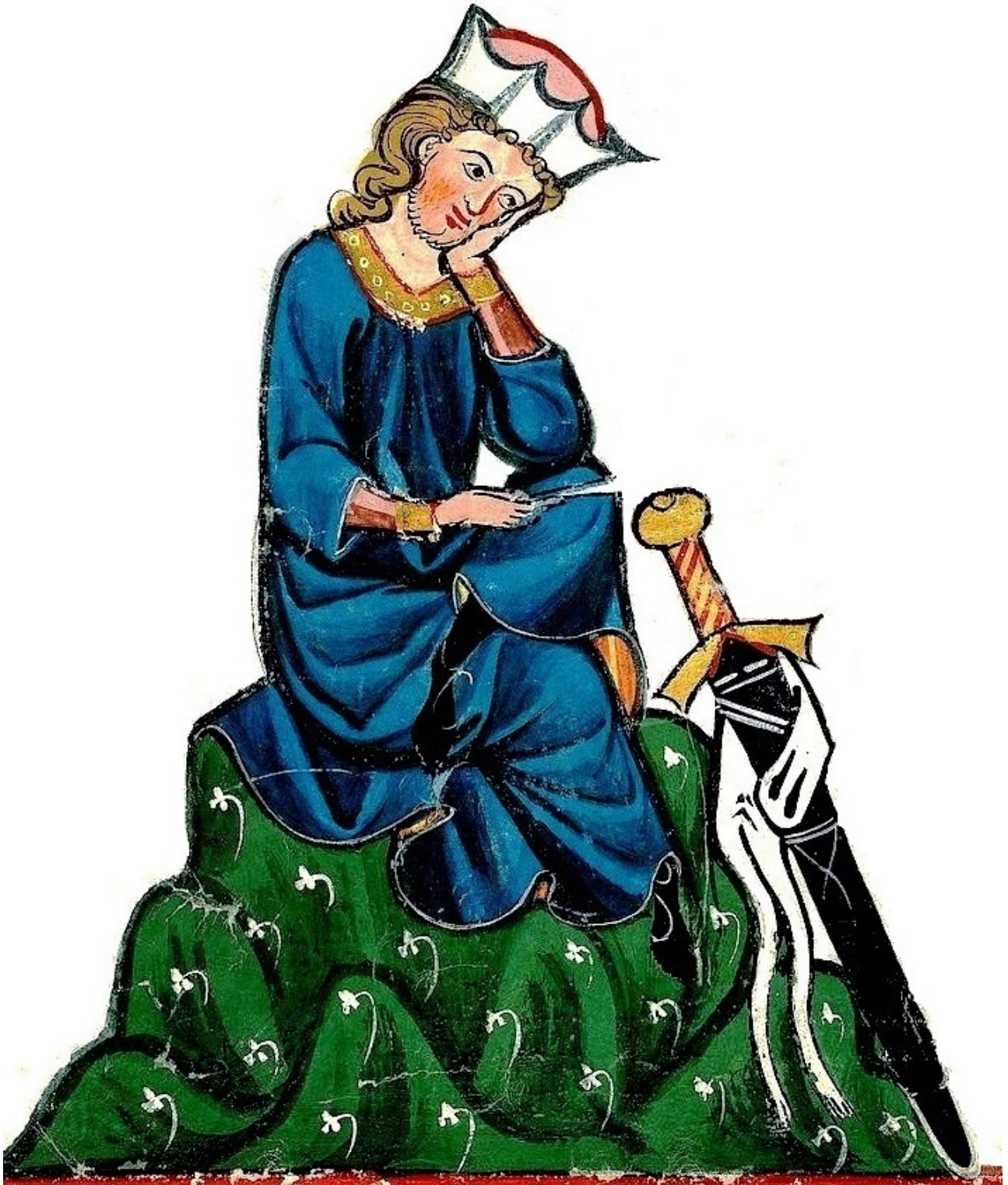
Рис. 2. Зображення «U» – подібного наконечника піхов меча на мініатюрі Манеського кодексу (1300–1340 рр.)