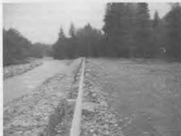
Рис. 5. Берегоукріплюючі та проти-паводкові споруди, р. Бисків

Паводкова хвиля 12 серпня о 10 год. була зафіксована на р. Прут – м. Чернівці, період добігання 14 годин. Амплітуда підйому паводку в межах м. Чернівці становила 0,93 м, а інтенсивність підйому з 8 год. до 10 год. 12 серпня – 37 см/год.