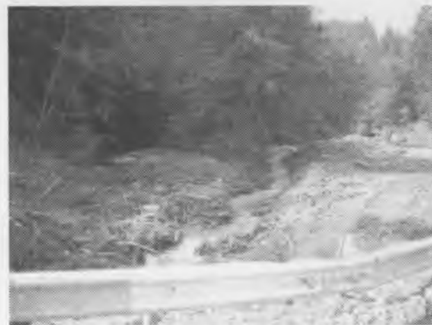
Рис. 6. Залишки селевого потоку, ліва притока (гальвег) р. Путила в межах смт. Путила Fig. 6. Remains of mudslides, left tributary of the river Putila within the urban Putila

Fig. 5. Shore protection and flood protection facilities, river Byskiv