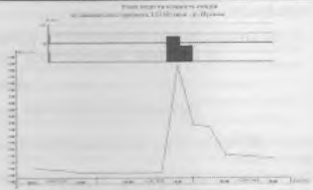
Рис. 2. Рівні води над нулем поста, см; кількість опадів за даними спостережень ГП Путила – р. Путила, 10 – 12 серпня 2010 року, мм Fig. 2. The water level and rainfall data for observations Putila - Putila River 12 August 2010

Уточнення коефіцієнтів шорсткості \frac{1}{n} для русла р. Путила – смт. Путила проводилося зворотни-