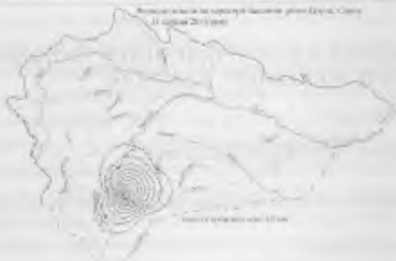
Рис. 1. Картохема ізогієт дощу 11 серпня 2010 року на території басейнів Пруту та Сирету Fig. 1. Distribution of rain August 11, 2010 in the Prut and Siret