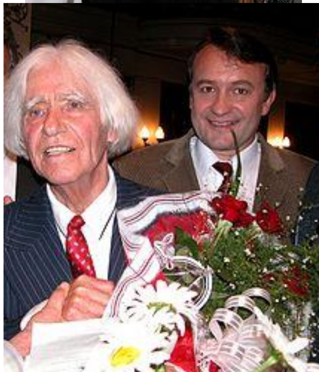
В колі сім'ї (2001)