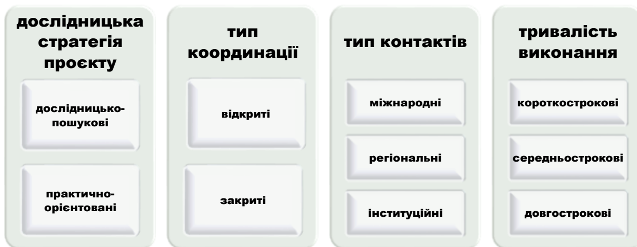
Малюнок 1. Класифікація проєктів у діяльності кафедри політології та державного управління

Відповідно до дослідницької стратегії проєктів розрізняють дослідницько-пошукові та практично-орієнтовані проєкти. Перші спрямовані на ознайомлення з інформацією про певні проблеми регіонального/локального характеру, аналіз та узагальнення наявних даних, другі орієнтовані на вирішення практичне вирішення проблеми засобами публічного управління. Тип координації реалізації проєкту дозволяє поділити їх на відкриті (передбачають участь координатора в організації окремих етапів проєкта, консультаційний супровід у разі необхідності) та закриті (самостійність виконавця в реалізації проєкту). За типом контактів проєкти поділяються на міжнародні, регіональні та інституційні. За тривалістю реалізації виокремлюють короткострокові, середньострокові та довгострокові проєкти.