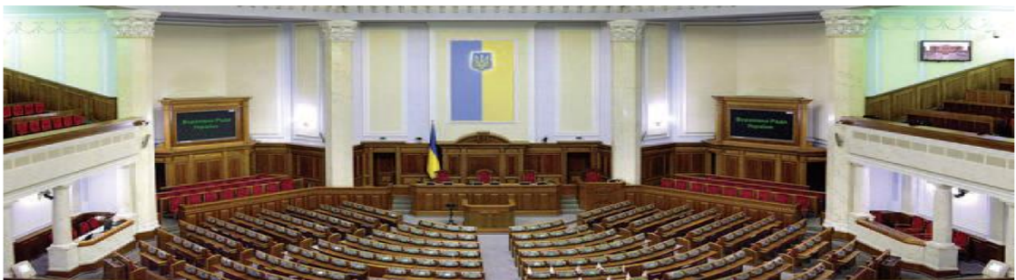
ФОТО СЕСІЙНОЇ ЗАЛИ ВЕРХОВНОЇ РАДИ УКРАЇНИ ТА КАРТКИ