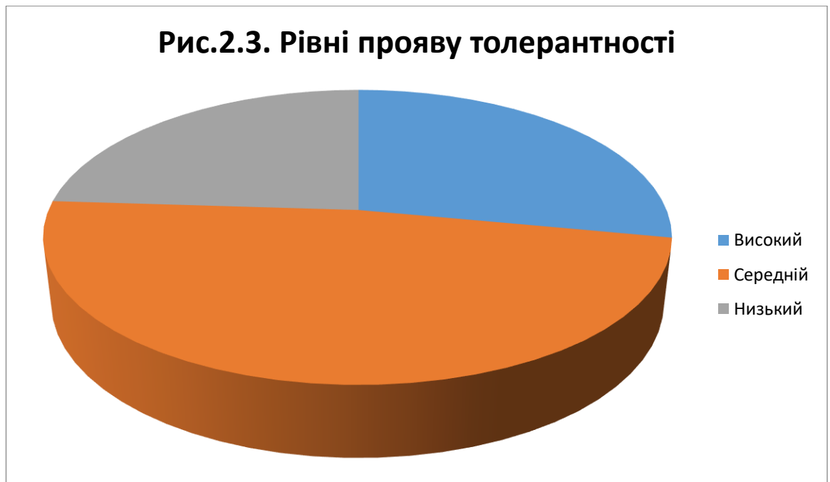
Рис.2.3. Рівні прояву толерантності

В результаті ми отримали дані, за якими до високого рівня толерантності віднесено 7 учнів (28%), до середнього 12 осіб (48%), до низького – 6 осіб (24%).