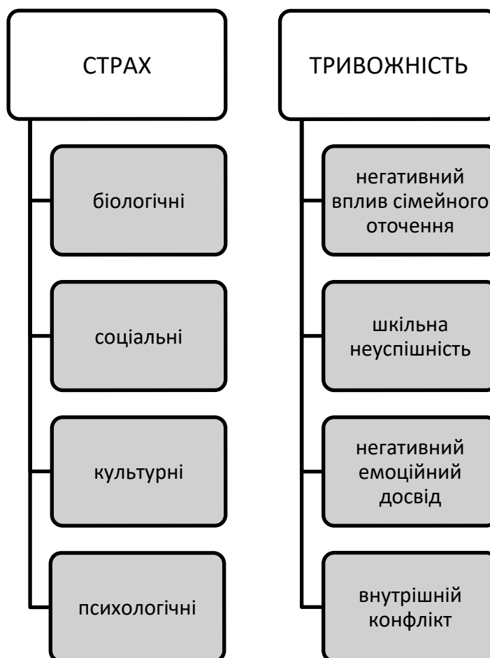
Рис. 1.4. Причини страхів і тривожності дітей

Отже, основними причинами виникнення страхів у дітей є: наявність страхів у батьків, тривожність у відносинах з дитиною, гіперопіка або велика свобода, ізоляція від спілкування з однолітками, велика кількість заборон з боку батьків, тривалі і нерозв'язні переживання дитини, психічні травми, психологічне зараження страхами в процесі безпосереднього спілкування з однолітками та дорослими; конфлікти та психотравматичні переживання, довготривала самотність. До виникнення тривожності у дітей призводять внутрішнє напруження, почуття безсилля, втрата почуття захищеності, почуття певної соціальної ізольованості, неадекватна самооцінка, негативні взаємини у сімейному середовищі, шкільна успішність чи неуспішність; несприятливі взаємовідносини з вчителями й однолітками, внутрішній конфлікт, несприятливий емоційний досвід.